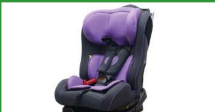
Автокресло группы II для детей массой 15-25 кг