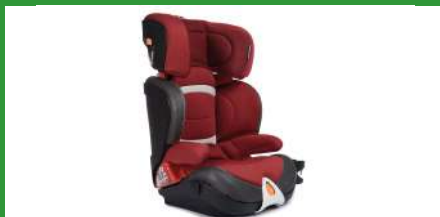
Автокресло группы III для детей массой 22-36 кг (возможно использование бустера)