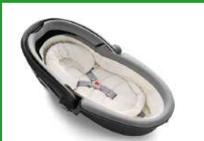
Автокресло «люлька» группы 0 для детей массой менее 10 кг

Детские удерживающие устройства подразделяют на 5 весовых групп: