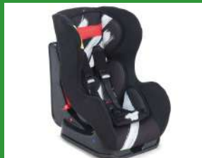
Автокресло группы I для детей массой 9-18 кг