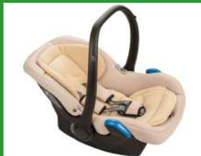
Автокресло группы 0+ для детей массой менее 13 кг